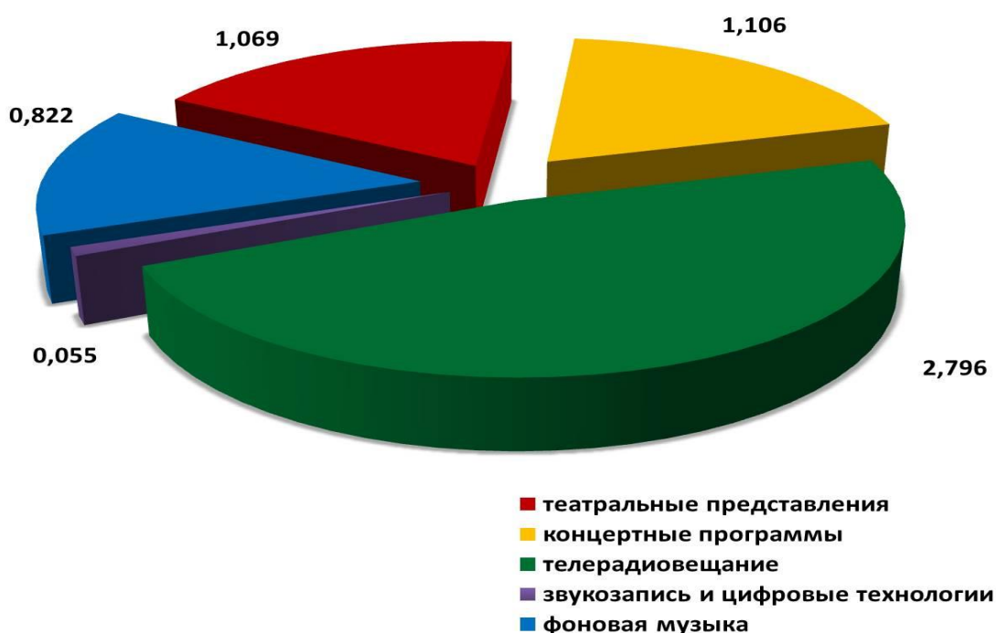
Рис. 2. Структура собранного в 2018 году вознаграждения по секторам использования (млн. руб.)

Распределение поступающего вознаграждения осуществлялось в соответствии с Инструкцией о порядке распределения вознаграждения, собранного в ходе ведения коллективного управления имущественными правами, утвержденной приказом генерального директора НЦИС от 30.06.2010 № 79 в редакции, утвержденной приказом генерального директора НЦИС от 28.06.2016 № 45 (доступна для ознакомления на сайте НЦИС по ссылке: http://belgospatent.by/russian/docs/instr28_06_2016.pdf ).